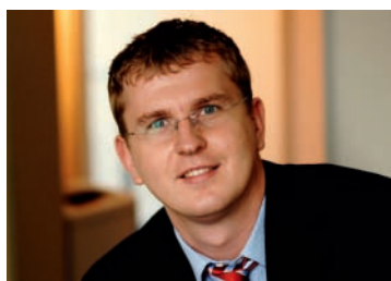
Dzmirty Nikulin Russkij, Deutsch, English

Телефон: +49 (0)541 96 20 20 Факс: +49 (0)541 96 20 222 E-Mail: service@kuenker.de интернет: www.kuenker.de