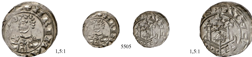
5505 Denar. 1,49 g. +HREMAN[N ARE] Brustbild des Erzbischofs I. mit Krummstab und Buch// +ANCT[A COLONA]S Mauerring mit vier Türmen. Dannenberg 415 b; Hävernicks 421; Kluge 371. Leicht dezentriertes, sonst vorzügliches Exemplar 250,--