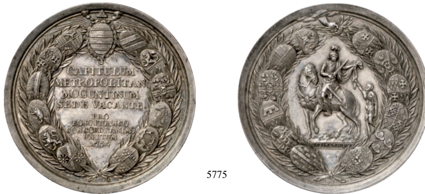
5775 Sedisvakanz 1774. Silbermedaille 1774, von A. F. Stieler. Acht Zeilen Schrift und Jahreszahl, umher Wappenkranz mit Lorbeerzweigen, oben strahlendes Symbol der Dreifaltigkeit in Wolken//Der Heilige Martin mit Schwert reitet l. und teilt seinen Mantel mit einem am Boden stehenden Bettler, oben hält eine aus Wolken kommende Hand den umherführenden Wappenkranz mit Lorbeerzweigen. 52,17 mm; 43,82 g. Slg. Walther 639; Zepernick 25.