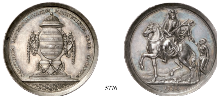
5776 Silbermedaille 1774, von A. F. Stieler. Kapitelwappen an mit Girlanden geschmückten Urne, im Abschnitt Verzierungen//Der Heilige Martin mit Schwert reitet l. und teilt seinen Mantel mit einem am Boden stehenden Bettler, im Abschnitt Jahreszahl. 43,95 mm; 29,25 g. Slg. Walther 640; Zepernick 268.