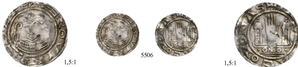
5506 Denar. 1,35 g. +HERGVINDACHE Brustbild des Erzbischofs v. v. mit Krummstab//+////ACOLONAS Verzierte Mauerleiste, darüber Hand zwischen zwei Kuppeltürmen. Dannenberg 414 var.; Hävernicks 429; Kluge 370 var. RR Prägeschwäche, sehr schön + 250,--