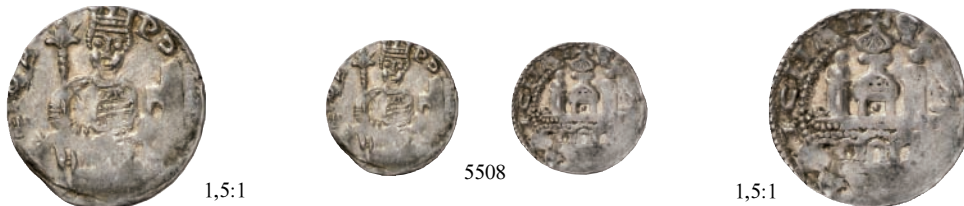
5508 Pfennig, unbestimmte Münzstätte (vermutlich Bielstein). 1,31 g. Kaiser mit Lilienzepter und Beil thront v. v. auf einem Faltstuhl, der mit Tierköpfen verziert ist//Nach dem Kölner Vorbild auf Arkaden errichtetes, dreitürmiges Gebäude mit einem Hauptturm und zwei Seitentürmen. Hävernicks 561. RR Prägeschwäche, sehr schön 300,--