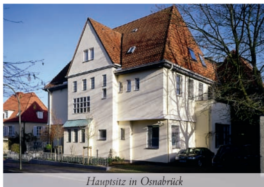
Hauptsitz in Osnabrück