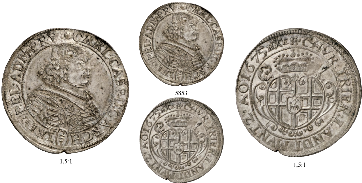
5853 Karl Kaspar von der Leyen, 1652-1676. 2/3 Taler 1675, Koblenz. Dav. 1020 (dort nur als Zeichnung); v. Schr. 382.