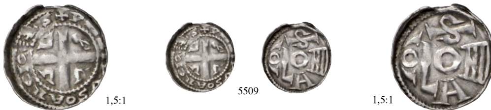
5509 Denar, 1167-1191, Soest. 1,36 g. Kreuz, in den Winkeln V - Kugel mit dem Soester Zeichen - V - V//Coloniamonogramm. Hävernicks 882. Kl. Randfehler, sonst attraktives, sehr schönes Exemplar 150,--