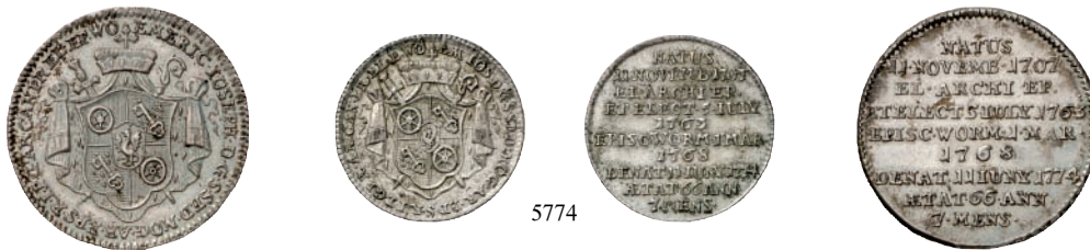
5774 30 Kreuzer (1/4 Konv.-Taler) und 10 Kreuzer (1/12 Taler) 1774, beide Münzstätte Mainz, auf seinen Tod. Slg. Walther 626, 628.

Stieler ist der Stempelschneider dieses Rheingold-Dukaten mit der ungewöhnlich monumentalen Rückseiten-Aufschrift. Die Vorderseiten-Umschrift löst sich wie folgt auf: EM(ericus) IOS(ephus) D(eo) G(ratiae) A(rchi) EP(iscopus) M(ogontiacum) S(acri) R(omani) I(mperii) P(er) G(ermaniae) A(rchi) C(ancellarius) P(rimus) EL(ector) E(piscopus) W(ormatiae). Geprägt wurde das Stück von Damian Fritsch.