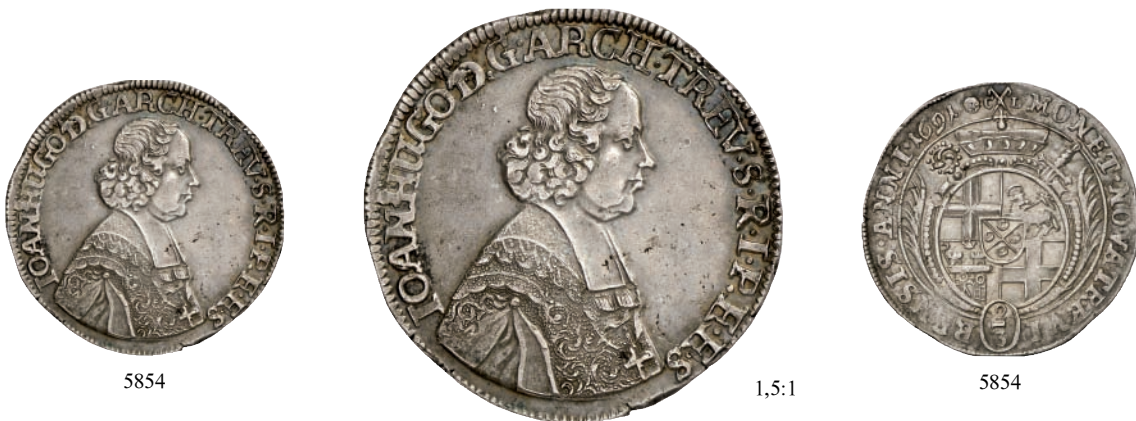
5854 Johann Hugo von Orsbeck, 1676-1711. 2/3 Taler 1691, Koblenz. Ohne Binnenreif auf der Vorderseite. Dav. 1023 B; v. Schr. 646 var. Hübsche Patina, kl. Schrötlingsfehler am Rand, sehr schön-vorzüglich