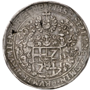
5852 Philipp Christoph von Sötern, 1623-1652. Reichstaler 1624, Koblenz. Dav. 5887; v. Schr. 264. RR Kl. Schrötlingsfehler, starker Doppelschlag, sehr schön