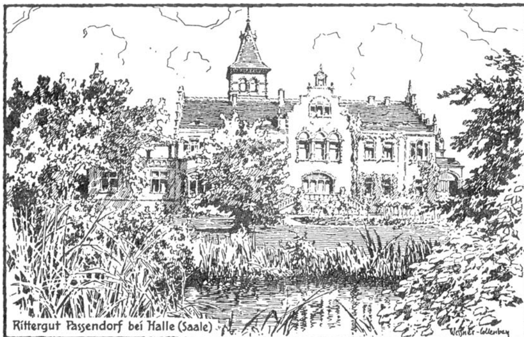
Rittergut Passendorf bei Halle (Saale)