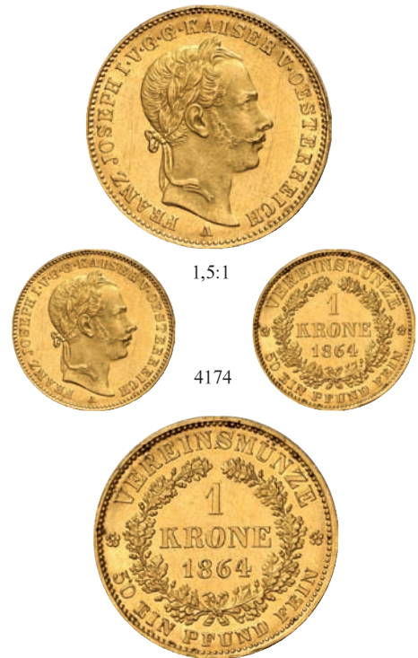
4174 Vereinskronen 1864 A, Wien. 10,00 g Feingold. Divo/S. 256; Fb. 496; J. 315; Schl. 417. GOLD. R Nur 1.530 Exemplare geprägt. Vorzüglich-Stempelglanz 7.000,--