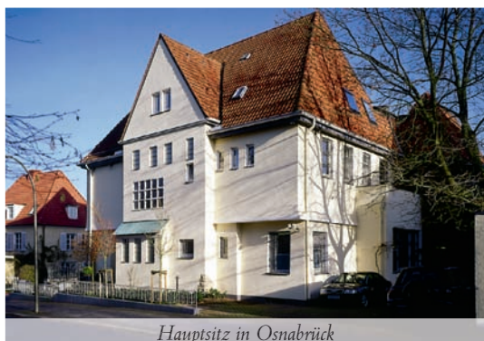
Hauptsitz in Osnabrück