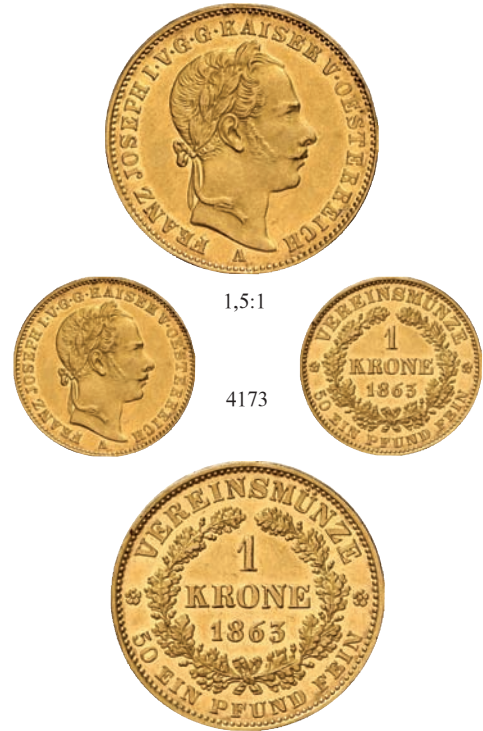
4173 Vereinskronen 1863 A, Wien. 10,00 g Feingold. Divo/S. 256; Fb. 496; J. 315; Schl. 416. GOLD. RR Nur 1.000 Exemplare geprägt. Fast vorzüglich 4.000,--