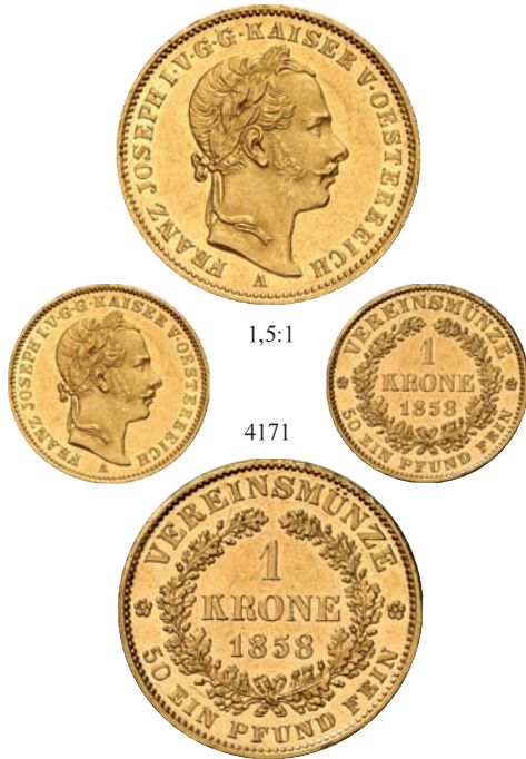
4171 Vereinskronen 1858 A, Wien. 10,00 g Feingold. Divo/S. 256; Fb. 496; J. 315; Schl. 412. GOLD. R Vorzüglich 3.000,--