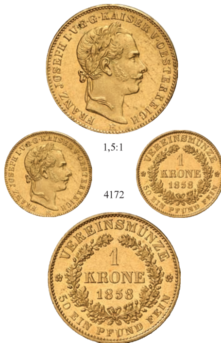
4172 Vereinskronen 1858 E, Karlsburg. 10,00 g Feingold. Divo/S. 257; Fb. 229; J. 315; Schl. 421. GOLD. R Min. berieben, vorzüglich 2.500,--