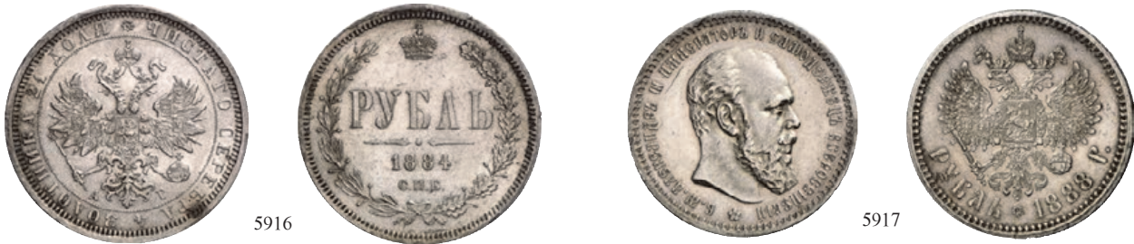
5916 Rubel 1884, St. Petersburg. In US-Plastikholder der PCGS mit der Bewertung AU 58. Bitkin 45; Dav. 289 (dort unter Alexander II.). Vorzüglich 500,--