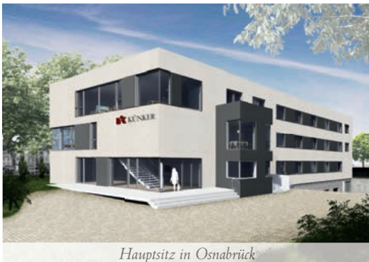
Hauptsitz in Osnabrück