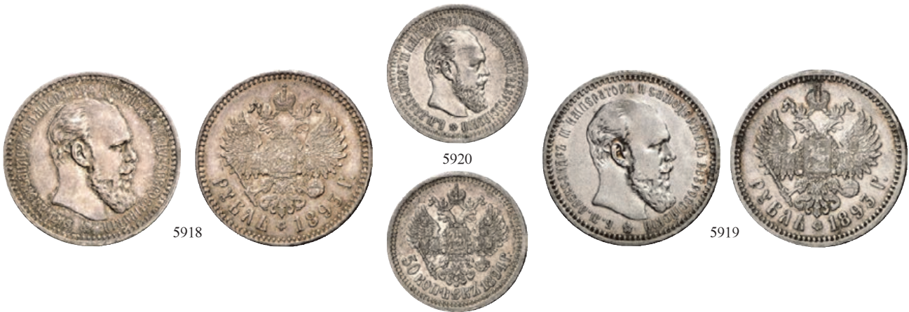
5918 Rubel 1893, St. Petersburg. 19,99 g. Bitkin 77; Dav. 292. Fast vorzüglich 400,-- Exemplar der Auktion Gorny & Mosch 116, München 2002, Nr. 2092.