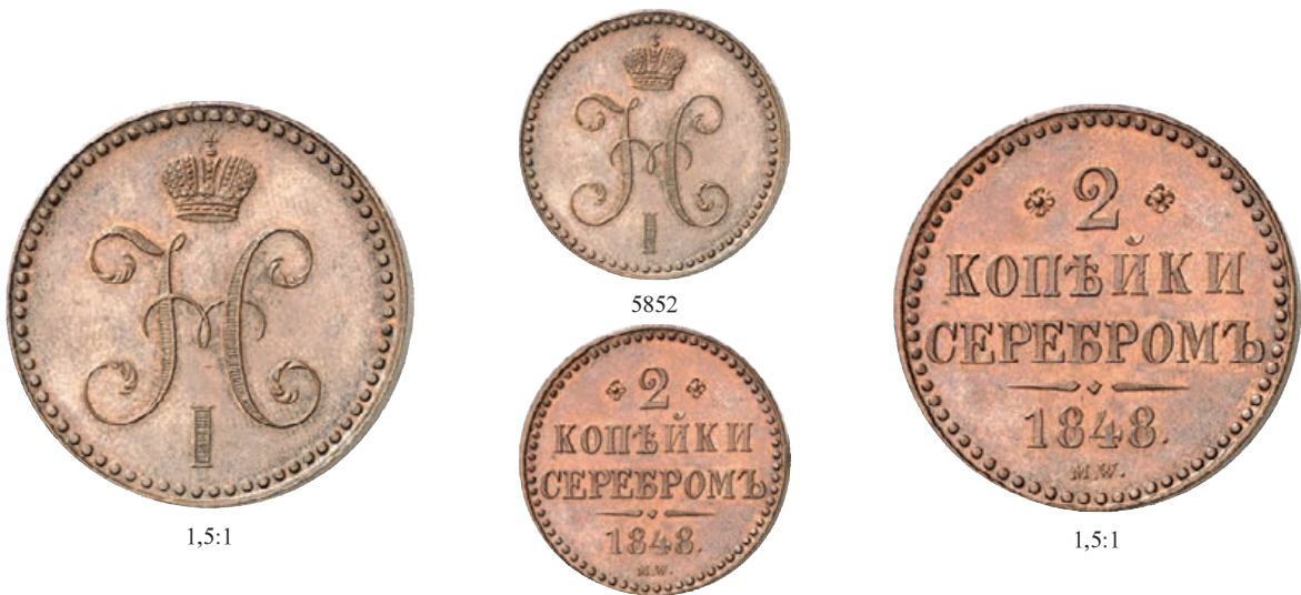
5852 Ku.-2 Kopeken 1848, Warschau. 20,27 g. Bitkin 848 (R2). RR Feine Patina, vorzüglich-Stempelglanz 5.000,--