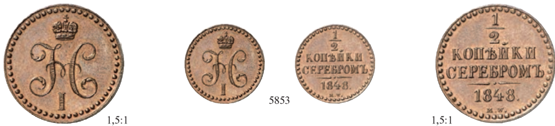
5853 Ku.-1/2 Kopeke 1848, Warschau. 5,12 g. Bitkin 849 (R2). RR Sehr attraktives Exemplar, vorzüglich-Stempelglanz 1.000,--