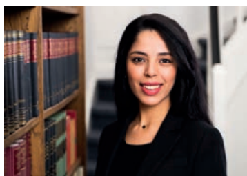
Kmar Chachoua Français, Deutsch, English, Arabic

Tél. +49 (0)541 96 20 20 Facs. +49 (0)541 96 20 222 E-Mail: service@kuenker.de Site: www.kuenker.de