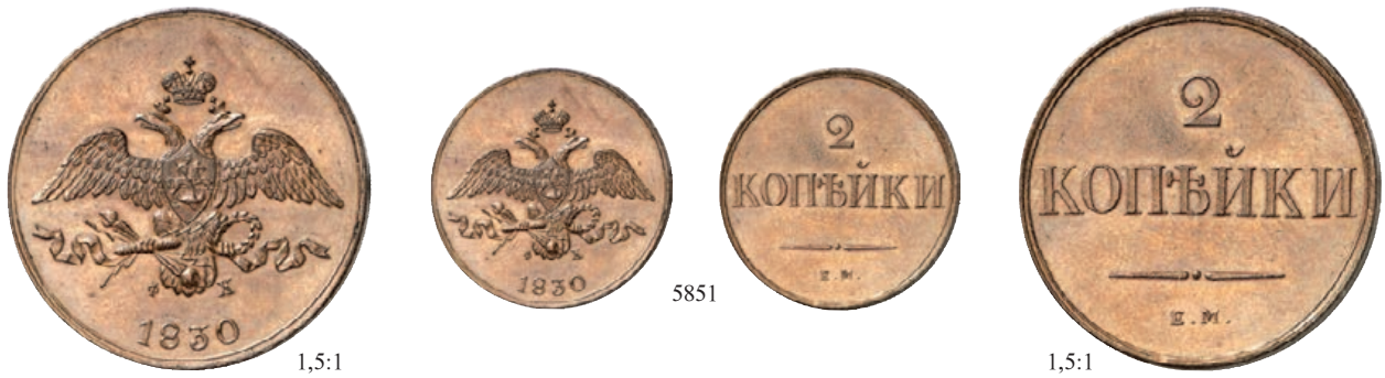
5851 Ku.-2 Kopeken 1830, Ekaterinburg. Novodel. 9,99 g. Bitkin H 504 (R2). RR Vorzüglich-Stempelglanz 1.000,--