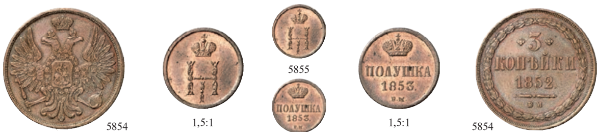
5854 Ku.-3 Kopeken 1852, Warschau. 15,27 g. Bitkin 857 (R). R Fast vorzüglich 500,--