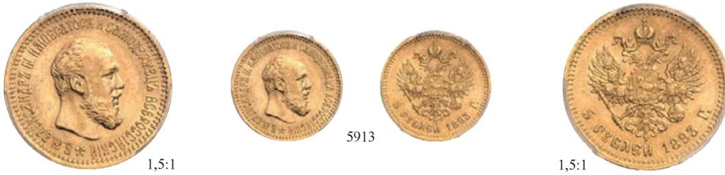
5913 5 Rubel 1893, St. Petersburg. In US-Plastikholder der PCGS mit der Bewertung MS 62. Bitkin 39; Fb. 168; Schl. 185. GOLD. Seltener Jahrgang. Vorzüglich-Stempelglanz 1.000,--