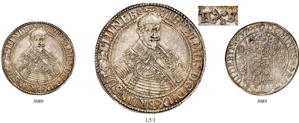
3089 Reichstaler 1637, Zellerfeld. 28,79 g. Münzmeister Henning Schlüter. Mit Münzmeisterzeichen gekreuzte Schlüssel zwischen HS auf der Rückseite. Bahrf. 69 a; Dav. 6408; Welter 724. Von großer Seltenheit. Sehr attraktives Exemplar mit feiner Tönung, fast vorzüglich 1.500,-- Exemplar der Auktion Greiser 21, Hannover 1985, Nr. 451.