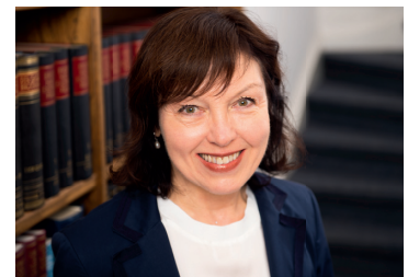
Marion Künker English, Deutsch

Phone: +49 541 96202 0 Fax: +49 541 96202 22 E-Mail: service@kuenker.de Website: www.kuenker.com