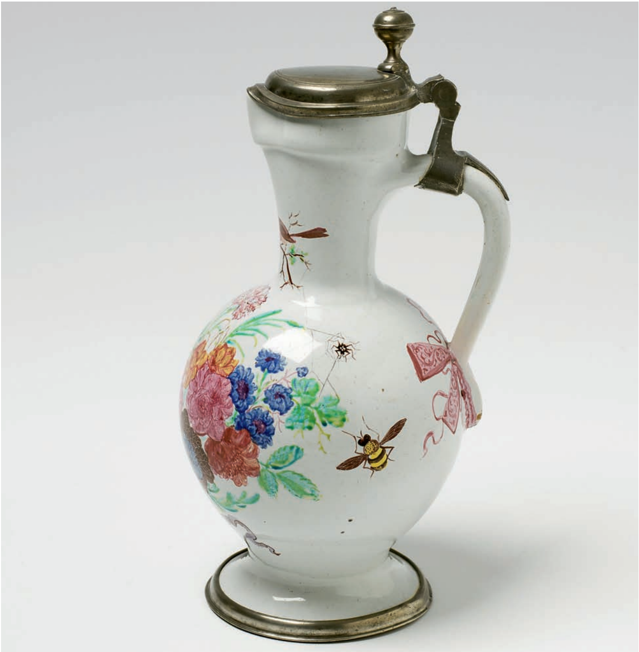
AUGSBURGER HAUSMALERKRUG. Dekor Bartholomäus Seuter zugeschrieben, die Fayence Hanau, um 1720. H 25 cm Verkauft für: € 49.000,-