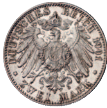
6255 80 2 Mark 1901. Vorzüglich-Stempelglanz 250,--