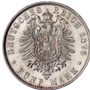
6134 42 5 Mark 1876. Vorzüglich 175,--