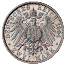
6257 81 2 Mark 1904. Vorzüglich-Stempelglanz 125,--