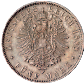
6534 173 5 Mark 1888. Kräftige Patina, vorzüglich-Stempelglanz 1.000,--