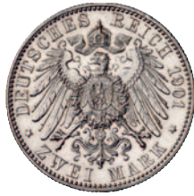
Jaeger 6254 80 2 Mark 1901. Vorzüglich-Stempelglanz 250,--