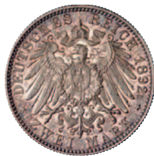
6536 174 Wilhelm II., 1891-1918. 2 Mark 1892. Hübsche Patina, fast Stempelglanz 125,--