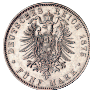
6209 67 5 Mark 1875. Überdurchschnittlich erhaltenes Exemplar. Sehr schön-vorzüglich 400,--