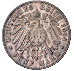
6274 83 5 Mark 1904. Fast vorzüglich 300,--