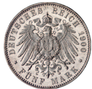
6543 176 5 Mark 1900. Vorzüglich + 100,--