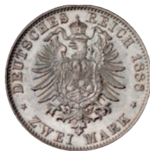
6135 43 Otto II., 1886-1913. 2 Mark 1888. Prachtexemplar. Fast Stempelglanz/Stempelglanz 1.000,--