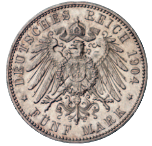
Jaeger 6273 83 5 Mark 1904. Fast vorzüglich 300,--