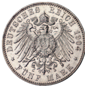
6272 83 5 Mark 1904. Vorzüglich-Stempelglanz 400,--