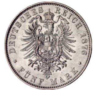
6211 67 5 Mark 1876. Überdurchschnittlich erhaltenes Exemplar. Sehr schön-vorzüglich 400,--