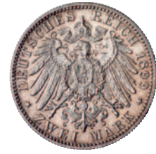
Jaeger 6538 174 2 Mark 1899. Vorzüglich-Stempelglanz 75,--