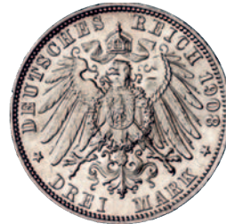
6263 82 3 Mark 1908. Vorzüglich 100,--