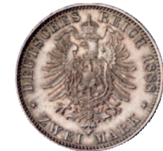
6213 68 Ludwig IV., 1877-1892. 2 Mark 1888. R Herrliche Patina, vorzüglich-Stempelglanz 3.000,--