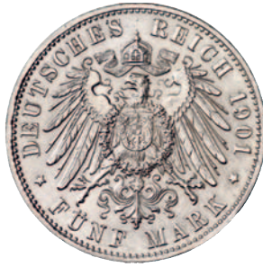
Jaeger 6205 65 5 Mark 1901. Vorzüglich-Stempelglanz 150,--