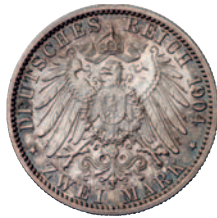
6256 81 2 Mark 1904. Hübsche Patina, fast Stempelglanz 150,--