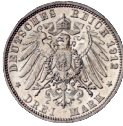
Jaeger 6268 82 3 Mark 1912. Vorzüglich 100,--