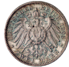
6540 174 2 Mark 1905. Herrliche Patina, fast Stempelglanz 75,--