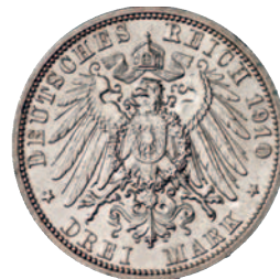
6266 82 3 Mark 1910. Vorzüglich 100,--