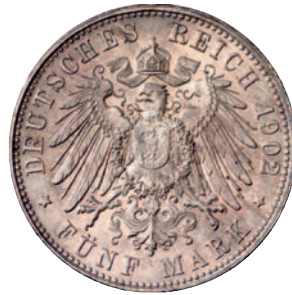
6206 65 5 Mark 1902. Herrliche Patina, vorzüglich-Stempelglanz 150,--