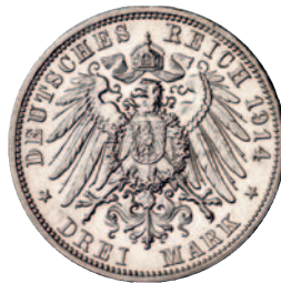
6270 82 3 Mark 1914. Vorzüglich-Stempelglanz 125,--