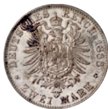
6136 43 2 Mark 1888. Etwas fleckig, fast Stempelglanz 750,--