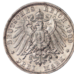
6264 82 3 Mark 1909. Prachtexemplar. Vorzüglich-Stempelglanz 125,--