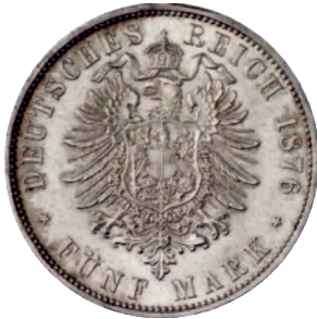
6133 42 5 Mark 1876. Vorzüglich + 200,--