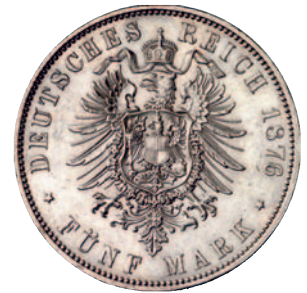
6212 67 5 Mark 1876. Überdurchschnittlich erhaltenes Exemplar. Sehr schön-vorzüglich 400,--