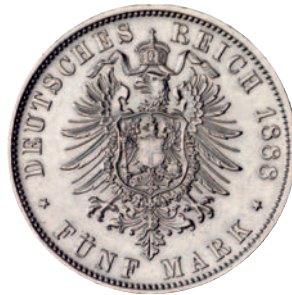
6535 173 5 Mark 1888. Leicht berieben, vorzüglich 400,--