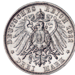
6267 82 3 Mark 1911. Vorzüglich 100,--