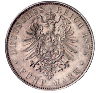
Jaeger 6210 67 5 Mark 1876. Selten in dieser Erhaltung. Hübsche Patina, vorzüglich 1.250,--