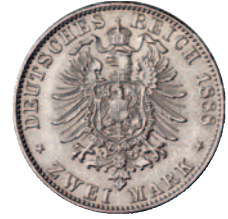
Jaeger 6137 43 2 Mark 1888. Vorzüglich + 500,--