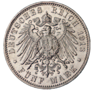
6277 83 5 Mark 1913. Vorzüglich-Stempelglanz 600,--