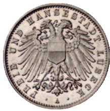
6259 81 2 Mark 1905. Vorzüglich 100,--