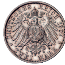
Jaeger 6261 81 2 Mark 1907. Vorzüglich-Stempelglanz 125,--