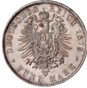
Jaeger 6132 42 5 Mark 1875. Vorzüglich 175,--