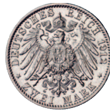
6262 81 2 Mark 1912. Vorzüglich 100,--