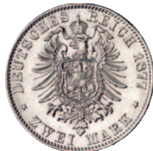
6208 66 Ludwig III., 1848-1877. 2 Mark 1877. Selten in dieser Erhaltung. Winz. Kratzer, vorzüglich 1.500,--