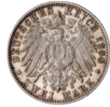
6539 174 2 Mark 1900. Fast Stempelglanz 100,--