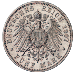
6275 83 5 Mark 1907. Vorzüglich-Stempelglanz 400,--