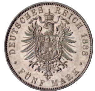
6214 69 5 Mark 1888. R Vorzüglich 2.000,--