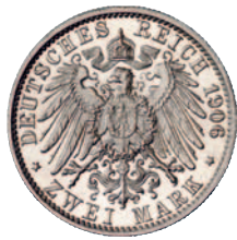
6260 81 2 Mark 1906. Fast Stempelglanz 150,--