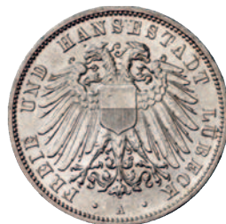
6265 82 3 Mark 1909. Vorzüglich 100,--