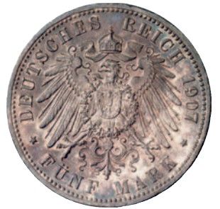
6276 83 5 Mark 1907. Vorzüglich 350,--