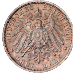
6269 82 3 Mark 1913. Hübsche Patina, vorzüglich-Stempelglanz 125,--