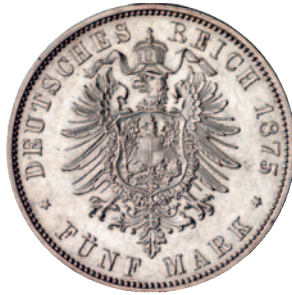
Jaeger 6533 173 5 Mark 1875. Vorzüglich 450,--