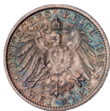
6258 81 2 Mark 1905. Kräftige Patina, vorzüglich 100,--