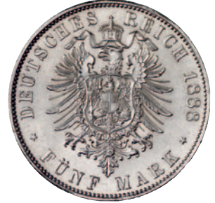
6138 44 5 Mark 1888. Prachtexemplar. Fast Stempelglanz 1.000,--