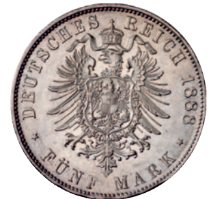
6141 44 5 Mark 1888. Winz. Druckstelle, vorzüglich + 600,--