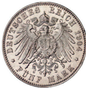
6271 83 5 Mark 1904. Fast Stempelglanz 500,--