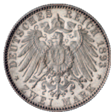
6537 174 2 Mark 1893. Vorzüglich-Stempelglanz 100,--