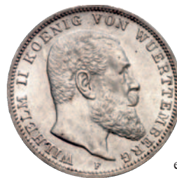
6541 174 2 Mark 1900, 1903, 1904, 1905, 1906, 1907, 1908, 1912, 1913, 1914. 10 Stück. Vorzüglich und besser 400,--