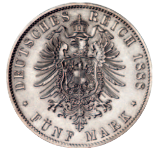
6139 44 5 Mark 1888. Vorzüglich-Stempelglanz 800,--