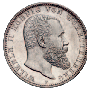
6542 175 3 Mark 1908, 1911, 1913, 1914. 4 Stück. Vorzüglich-Stempelglanz 50,--