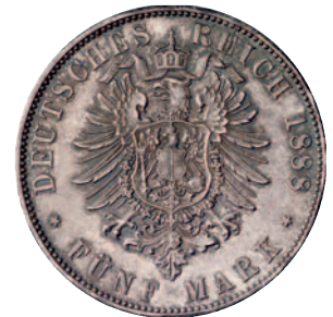
6140 44 5 Mark 1888. Hübsche Patina, vorzüglich/vorzüglich-Stempelglanz 750,--