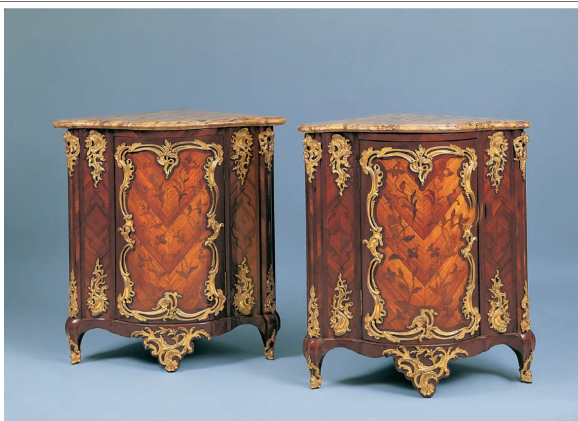
Paar Encoignuren époque Louis XV. Paris, Mitte 18. Jh., gestempelt „Carel“. Tulpenholz und Königsholz auf Eiche, vergoldete Bronzebeschläge, brèche d'Alep-Marmor, H 86, T 56 bzw. 59 cm. Verkauft für: € 102.000,-