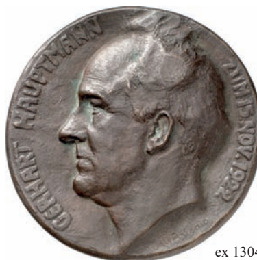
ex 1304 1:2