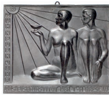
ex 1300 1:3