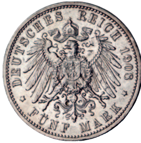
Jaeger 88 83 5 Mark 1908. Sehr schön-vorzüglich 275,--