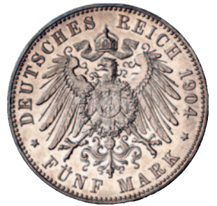
175 165 5 Mark 1904. Vorzüglich + 1.000,--