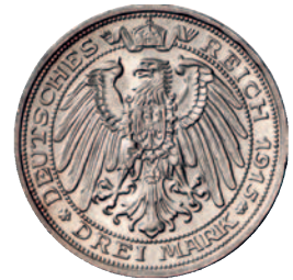
94 88 3 Mark 1915. Jahrhundertfeier. Sehr schön-vorzüglich 100,--