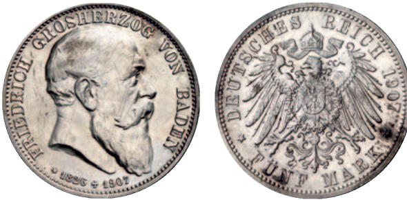
36 37 5 Mark 1907, mit Lebensdaten. Etwas fleckig, winz. Kratzer, sehr schön-vorzüglich 75,--