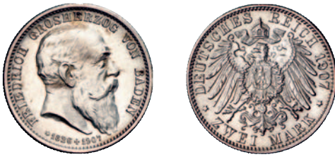
35 36 2 Mark 1907, mit Lebensdaten. Vorzüglich-Stempelglanz 50,--