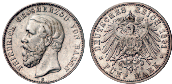
27 29F 5 Mark 1891, ohne Querstrich im A. R Schön-sehr schön 200,--