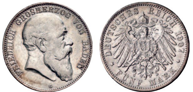
32 33 5 Mark 1902-1907. Komplette Serie. 4 Stück. Sehr schön 100,--