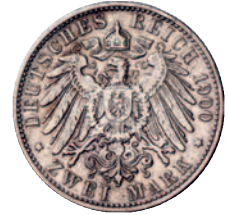
75 72 2 Mark 1900. Seltener Jahrgang. Fast sehr schön 250,--