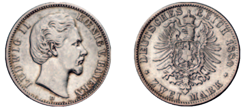
40 41 Ludwig II., 1864-1886. 2 Mark 1876-1883. Komplette Serie. 4 Stück. Fast sehr schön 100,--