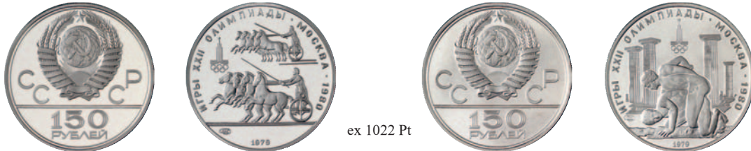
ex 1022 Pt