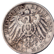
73 72 2 Mark 1898. Fast sehr schön 200,--