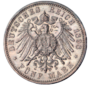
Jaeger 174 165 5 Mark 1898. Feine Patina, vorzüglich + 1.000,--