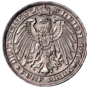
95 89 5 Mark 1915. Jahrhundertfeier. Sehr schön-vorzüglich 350,--