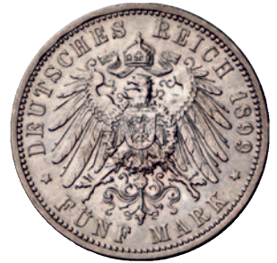
76 73 5 Mark 1895-1900. Komplette Serie. 4 Stück. Schön-sehr schön 400,--