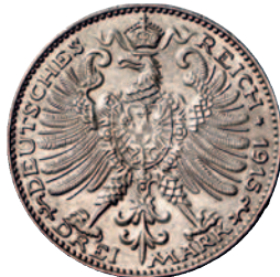
171 163 3 Mark 1915. Jahrhundertfeier. Vorzüglich 100,--