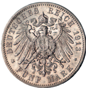
89 83 5 Mark 1913. Kl. Randfehler, sehr schön-vorzüglich 250,--