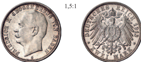
37 38 Friedrich II., 1907-1918. 2 Mark 1911, 1913. 2 Stück. Sehr schön und sehr schön-vorzüglich 400,--