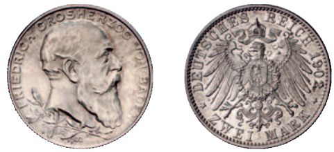
Jaeger 29 30 2 Mark 1902. Regierungsjubiläum. Vorzüglich 25,--