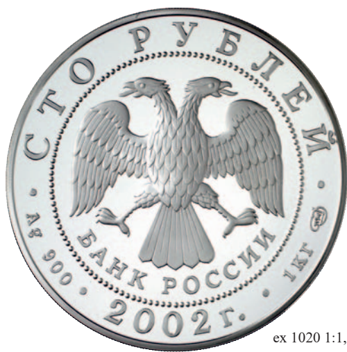
ex 1020 1:1,5

1018 Münzsatz 1996, bestehend aus 100, 25 und 3 Rubel (2 Varianten). Russisches Ballett - Nußknacker. Insgesamt 1.117,0 g Feinsilber. Yeo. 488, 485, 483, 482. 4 Stück. In Original-Holzschatulle. Polierte Platte 500,--