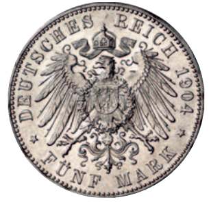
Jaeger 93 87 5 Mark 1904. Hochzeit. Vorzüglich 125,--