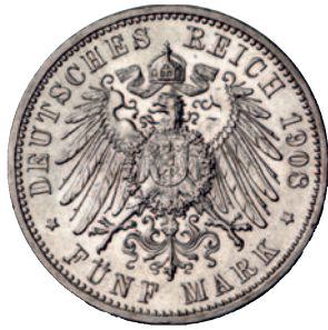
Jaeger 169 161 5 Mark 1908. Universität Jena. Vorzüglich 150,--