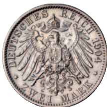
92 86 2 Mark 1904. Hochzeit. Sehr schön-vorzüglich 50,--