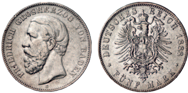
Jaeger 24 27 5 Mark 1888. RR Schön-sehr schön 250,--