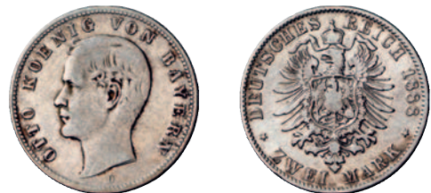
42 43 Otto II., 1886-1913. 2 Mark 1888. Fast sehr schön 250,--