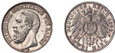
26 28 2 Mark 1902. RR Winz. Randfehler, sehr schön 400,--