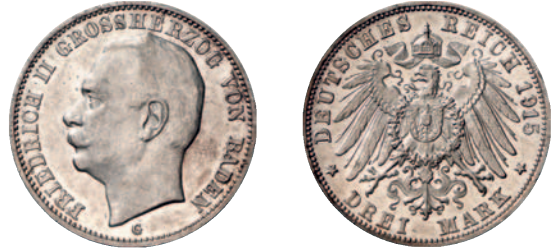
Jaeger 38 39 3 Mark 1908-1915. Komplette Serie. 7 Stück. Sehr schön-vorzüglich 75,--