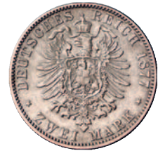
96 90 Friedrich Wilhelm, 1860-1904. 2 Mark 1877. Fast sehr schön 150,--