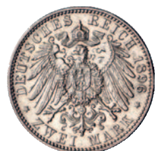
178 168 Karl Günther, 1880-1909. 2 Mark 1896. Sehr schön 175,--