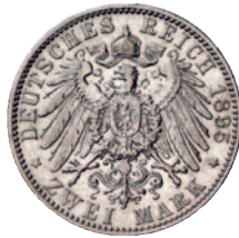
71 72 Ernst Ludwig, 1892-1918. 2 Mark 1895. Fast sehr schön 200,--