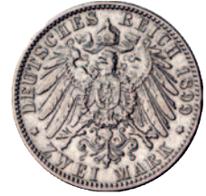
74 72 2 Mark 1899. Kl. Randfehler, fast sehr schön 175,-- Jaeger