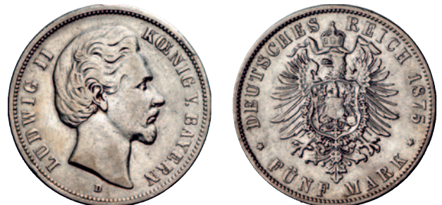
41 42 5 Mark 1874-1876. Komplette Serie. 3 Stück. Fast sehr schön und sehr schön 75,--