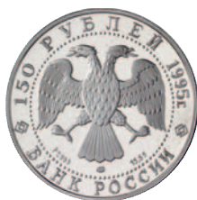
ex 1015 Pt