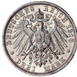
170 162 3 Mark 1910. Zur zweiten Hochzeit. Vorzüglich 50,--