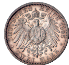
97 91 Adolf Friedrich V., 1904-1914. 2 Mark 1905. Herrliche Patina, vorzügliches Exemplar von polierten Stempeln 500,--