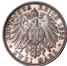
172 164 Georg, 1893-1911. 2 Mark 1898. Vorzüglich 500,--