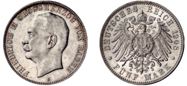
39 40 5 Mark 1908, 1913. 2 Stück. Sehr schön-vorzüglich und vorzüglich 60,--