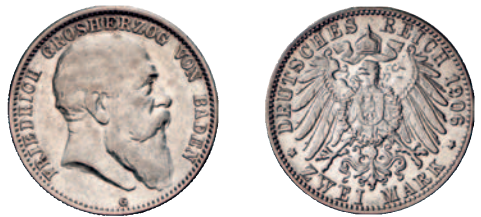
31 32 2 Mark 1902-1907. Komplette Serie. 6 Stück. Sehr schön 175,--