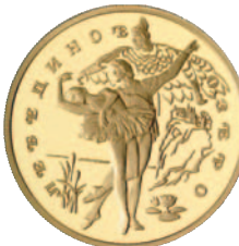
ex 1020 1:1,5