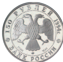
ex 1012 Pt