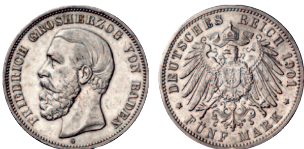
28 29 5 Mark 1891-1902. Komplette Serie. 9 Stück. Schön-sehr schön 200,--