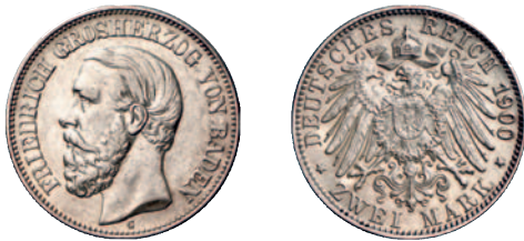
25 28 2 Mark 1892-1901. 7 Stück. Schön-sehr schön 200,--