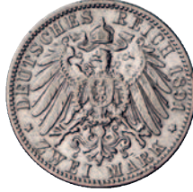
69 70 2 Mark 1891. Fast sehr schön 350,--