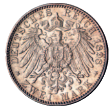
177 167 Günther, 1890-1918. 2 Mark 1898. Patina, sehr schön 175,--