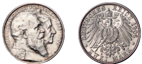
33 34 2 Mark 1906. Goldene Hochzeit. Vorzüglich-Stempelglanz 25,--