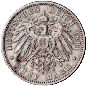
70 71 5 Mark 1891. Schön-sehr schön 300,--