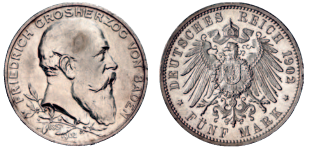
30 31 5 Mark 1902. Regierungsjubiläum. Feld der Vorderseite leicht überarbeitet, sehr schön/vorzüglich 50,--