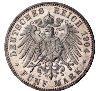
78 75 5 Mark 1904. Philipp der Großmütige. Vorzüglich 125,--