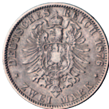
90 84 Friedrich Franz II., 1842-1883. 2 Mark 1876. Fast sehr schön 125,--