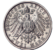
77 74 2 Mark 1904. Philipp der Großmütige. Winz. Randfehler, fast vorzüglich 40,--