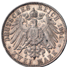
91 85 Friedrich Franz IV., 1897-1918. 2 Mark 1901. Sehr schön 250,--