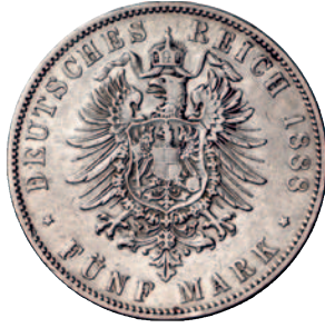
68 69 5 Mark 1888. R Fast sehr schön 800,-- Jaeger