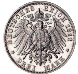
176 166 3 Mark 1911, mit Lebensdaten. Vorzüglich-Stempelglanz 100,--