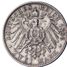
72 72 2 Mark 1896. Seltener Jahrgang. Fast sehr schön 250,--