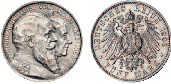
Jaeger 34 35 5 Mark 1906. Goldene Hochzeit. Vorzüglich + 125,--