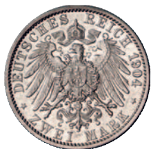
173 164 2 Mark 1904. Sehr schön-vorzüglich 400,--