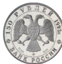
ex 1010 Pt