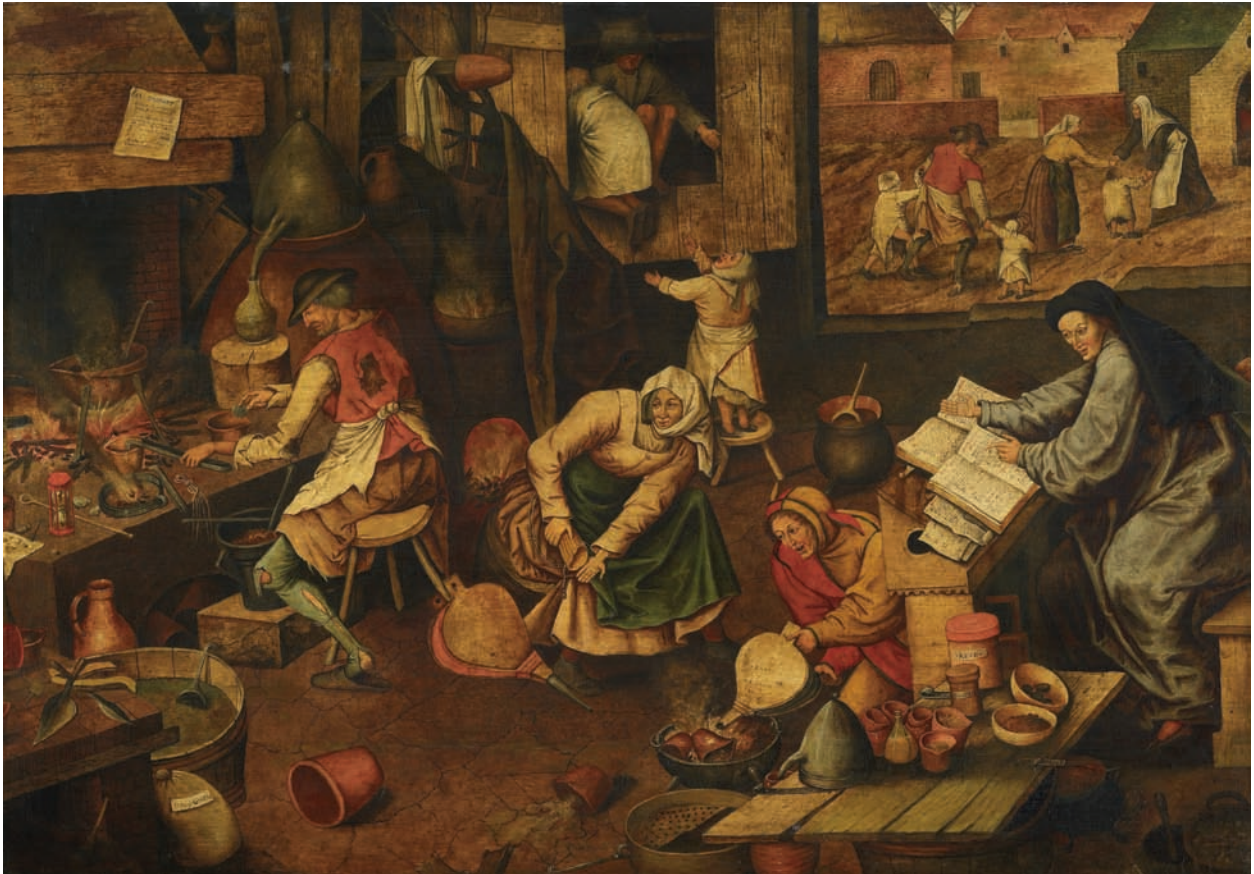
PIETER BRUEGHEL D. Ä., NACHFOLGER. Der Alchemist . Öl auf Holz, 68,8 x 96 cm. Verkauft für: € 1.680.000,-