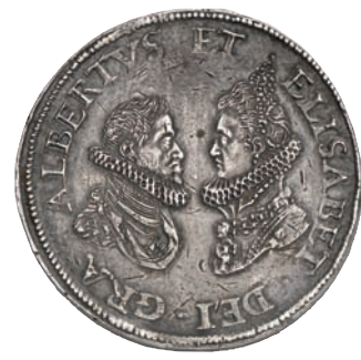
478 (4 Florins)