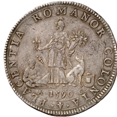
544 (2 Scudi)