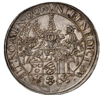
275 (1 1/2-fach)