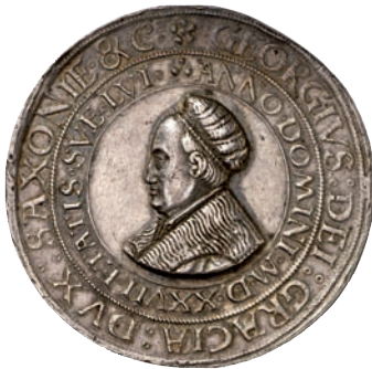
275 (1 1/2-fach)