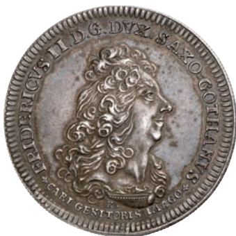
345 (1 1/2-fach)

Sehr selten, besonders in dieser Erhaltung. Herrliche Patina, winz. Schrötlingsfehler, vorzüglich 3.500,--