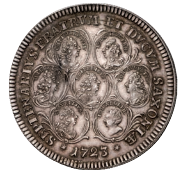
345 (1 1/2-fach)