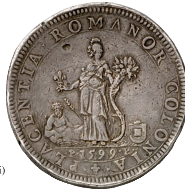
545 (3 Scudi)