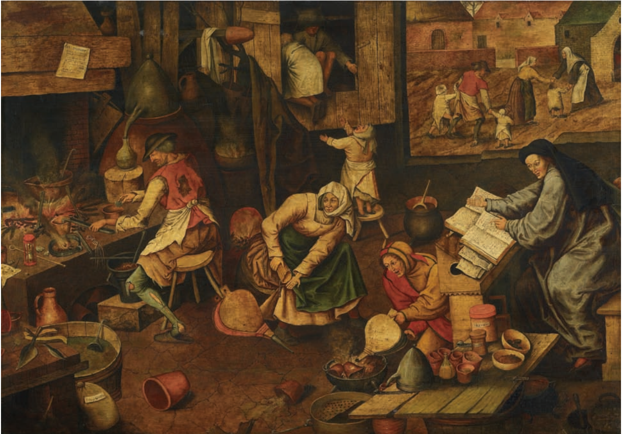
PIETER BRUEGHEL D. Ä., NACHFOLGER. Der Alchemist . Öl auf Holz, 68,8 x 96 cm. Verkauft für: € 1.680.000,-