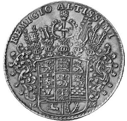
3365 (1 1/2-fach)