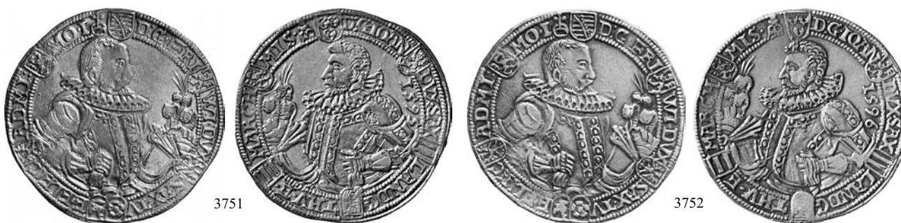
3751 Reichstaler 1595, Saalfeld. Variante mit vertauschten Wappenschildchen unten in der Vorderseitenumschrift. Dav. 9777; Schnee 250 var.

Sehr schön 150,-- Feine Patina, sehr schön 150,--