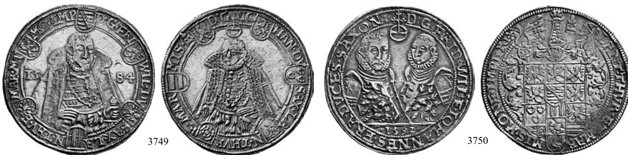
3749 Reichstaler 1584, Saalfeld. Dav. 9770; Schnee 238. 3750 Reichstaler 1592, Saalfeld. Dav. 9774; Schnee 245.

Sehr schön 150,-- Feine Patina, sehr schön 150,--