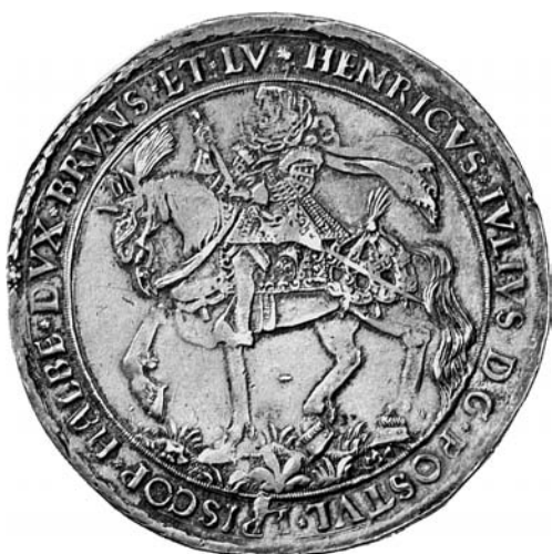
3350 (1 1/2-fach)