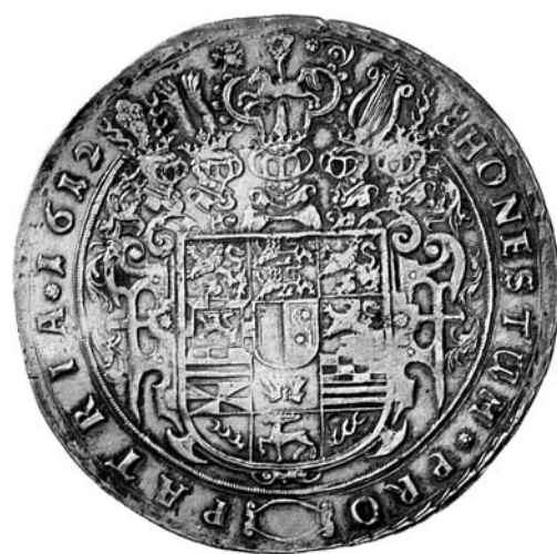
3350 (1 1/2-fach)