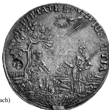
3397 (1 1/4-fach)