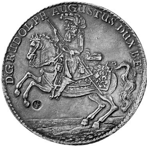
3365 (1 1/2-fach)