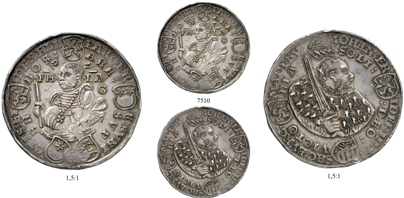
7510 Taler 1542, Goslar. 1. Schmalkaldischer Bundestaler. Gemeinschaftsprägung mit Kurfürst Johann Friedrich I. von Sachsen. 28,93 g. Außen: PARCER - E • SVBI - E - CTIS • ET - • DEBELL, innen: ARE • - SVP - ER - BOS •, die Interpunktionszeichen sind dreieckig. Geharnischtes Hüftbild halbl., in der Rechten Kommandostab, die Linke am Schwertgriff, zu den Seiten des Kopfes die geteilte Jahreszahl 4 - Z, darunter (Dreieck) PH (Dreieck) - (Dreieck) LA (Dreieck) / G, in der Umschrift der hessische Löwenschild sowie die Wappenschilder der Grafschaften Nidda, Diez, Ziegenhain und Katzenelnbogen// Außen: IOHAN • FR - IDERIH • D • - SAC • BVRG • - MADEBV •, innen: • SOLI • - • DEO • - VICTO - RIA • Brustbild des sächsischen Kurfürsten r. mit umgelegtem Mantel, mit beiden Händen das Schwert schulternd, in der Umschrift die Wappenschilder von Sachsen, Thüringen, Magdeburg und Meißen. Dav. 9737 (dort unter Sachsen); Schnee 119; Schütz 415.

Äußerst selten, besonders in dieser Erhaltung. Kabinettstück. Prachtvolle Patina, vorzüglich