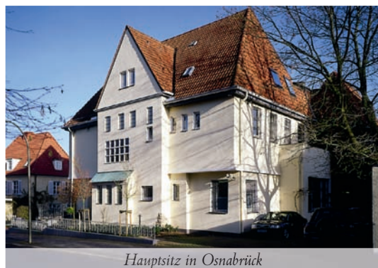
Hauptsitz in Osnabrück