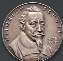
SÄCHSISCHE PERSÖNLICHKEITEN Schütz, Heinrich. *1585 Köstritz (Reuß), †1672 Dresden. Komponist. Silbermedaille 1935. Mattiert. In Silber sehr selten. Stempelglanz.