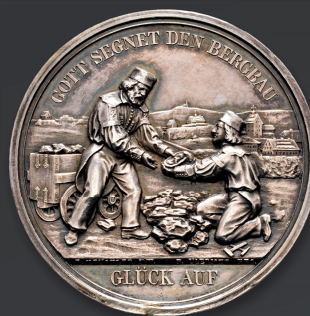
KÖNIGREICH SACHSEN Friedrich August II., 1836-1854. Silbermedaille 1847. Sehr selten, nur 200 Exemplare geprägt. Hübsche Patina, vorzüglich.