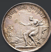
SÄCHSISCHE STÄDTE Freiberg. Silbermedaille 1743. Vorzüglich.