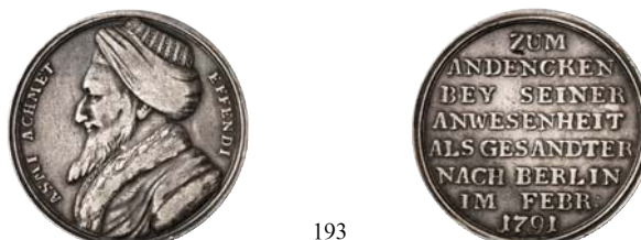
193 Silbermedaille 1791, unsigniert, auf den Besuch des türkischen Gesandten Asmi Achmet Effendi im Februar in Berlin. ASMI ACHMET - EFFENDI Brustbild Achmets I. mit Turban und Pelzkaftan//ZUM / ANDENCKEN / BEY SEINER / ANWESENHEIT / ALS GESANDTER / NACH BERLIN / IM FEBR : / 1791. 29,14 mm; 7,00 g. F. u. S. 4553; Marienb. 7455; Slg. Henckel 1921. Sehr schön 50,--