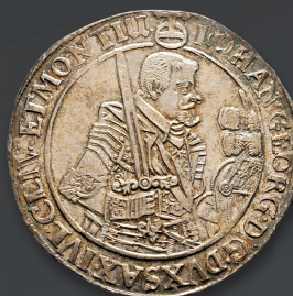
KURFÜRSTENTUM SACHSEN Johann Georg I., 1615-1656. Reichstaler 1643, Dresden. Feine Patina, vorzüglich - Stempelglanz.