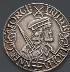
KURFÜRSTENTUM SACHSEN Friedrich III. der Weise, Johann und Georg, 1507-1525. Taler o.J., Annaberg. Sehr selten. Hübsche Patina, sehr schön - vorzüglich.