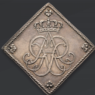
KURFÜRSTENTUM SACHSEN Friedrich August I., 1694-1733 (August der Starke). Talerklippe nach Leipziger Fuß 1714, Dresden. Sehr selten. Feine Patina, fast vorzüglich.