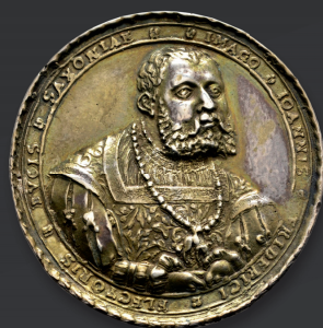
KURFÜRSTENTUM SACHSEN Johann Friedrich der Großmütige, 1532-1547. Silbergussmedaille 1537. Zeitgenössischer Guss. Reste alter Vergoldung, fein ziseliert, vorzüglich.

eLive Premium Auction, live am 7. und 8. Februar 2018 ab 18.00 Uhr