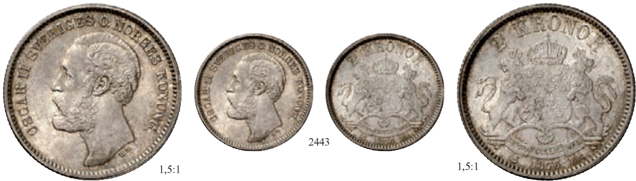
2443 2 Kronen 1876, Stockholm. Ahlström 46. Sehr selten in dieser Erhaltung. Kabinettstück von feinsten Erhaltung. Herrliche Patina, Stempelglanz 1.500,--