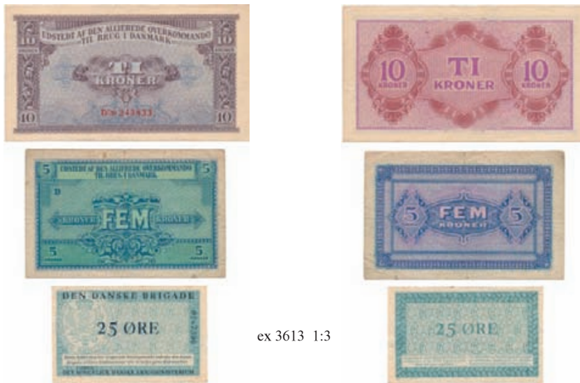
ex 3613 1:3