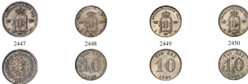
2447 25 Öre 1880, Stockholm. Ahlström 96. Prachtvolle Patina, vorzüglich-Stempelglanz 100,-- 2448 10 Öre 1883, Stockholm. Ahlström 116. Prachtexemplar. Herrliche Patina, fast Stempelglanz 75,-- 2449 10 Öre 1884, Stockholm. Ahlström 117. Prachtexemplar. Fast Stempelglanz 75,-- 2450 10 Öre 1892, Stockholm. Ahlström 121. Prachtexemplar. Patina, Stempelglanz 75,--