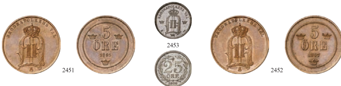
2451 Ku.-5 Öre 1895, Stockholm. Ahlström 154. Prachtexemplar. Fast Stempelglanz 75,-- 2452 Ku.-5 Öre 1897, Stockholm. Ahlström 156. Prachtexemplar. Fast Stempelglanz 75,-- 2453 25 Öre 1899, Stockholm. Ahlström 105. Selten in dieser Erhaltung. Prachtexemplar. Polierte Platte 150,--