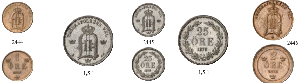
2444 Ku.-1 Öre 1877, Stockholm. Ahlström 202 b. Fast Stempelglanz 75,-- 2445 25 Öre 1878, Stockholm. Ahlström 95 a. Äußerst selten in dieser Erhaltung. Prachtexemplar. Polierte Platte 750,-- 2446 Ku.-2 Öre 1878, Stockholm. Ahlström 171 b. R Fast Stempelglanz 100,--