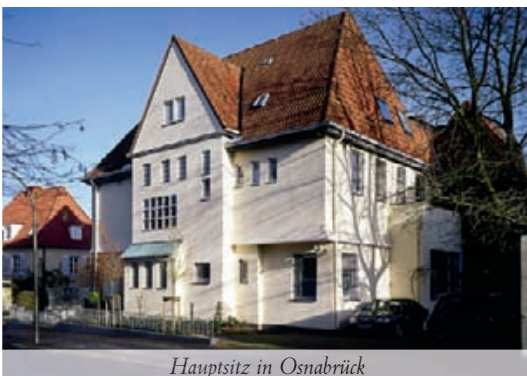
Hauptsitz in Osnabrück