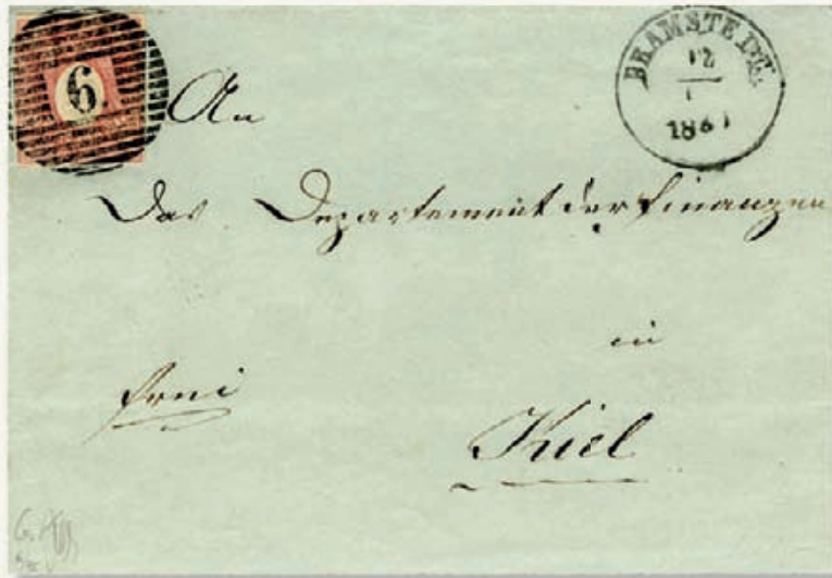
Aus der Sammlung „PETUELLI“: Der zweifellos schönste bekannte Brief der Schleswig-Holstein Mi.Nr. 2 und der einzige bekannte Brief der I. Ausgabe mit dem Stempel „Bramstedt“