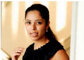
Kmar Chachoua Français, Deutsch, English, Arabic

Tél. +49 (0)541 96 20 20 Facs. +49 (0)541 96 20 222 E-Mail: service@kuenker.de Site: www.kuenker.de